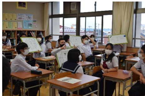
ふれあいタイム：(左) ゲームを説明する生徒 (右) 学級でのゲームの様子