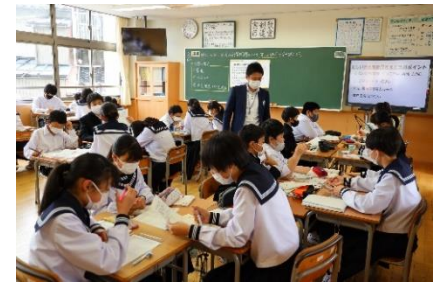
考えを話し合うグループ学習(数学)