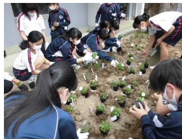
花壇の植え付け作業(委員会活動)