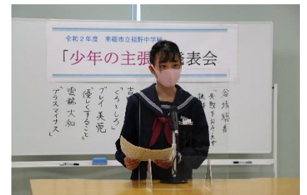
「少年の主張」発表会