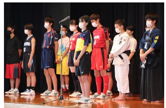
大会へ意気込みを話す部長(壮行会)