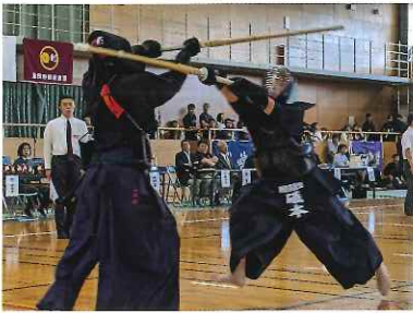
2019年 西三河大会 2回戦進出 豊田市大会 出場