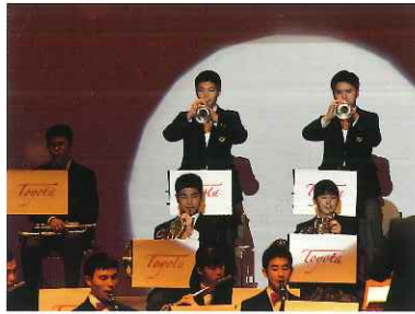
2018年愛知県吹奏楽コンクール 西三河北地区大会 銀賞