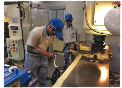
2021年 技能五輪全国大会 プラスチック金型職種 敢闘賞