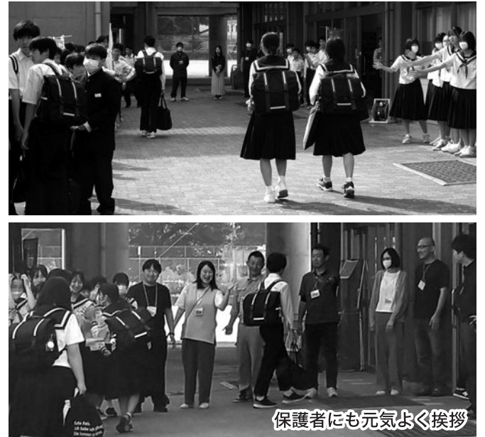
保護者にも元気よく挨拶

生徒会の活動である「あいさつ運動」に、育友会としても参加しました。今年は、生徒はクラスごとにリレー形式で実施してハイタッチであいさつ運動を行いました。実施クラスに合わせて保護者が参加し、生徒と共に自発的な挨拶マナーの向上を図りました。